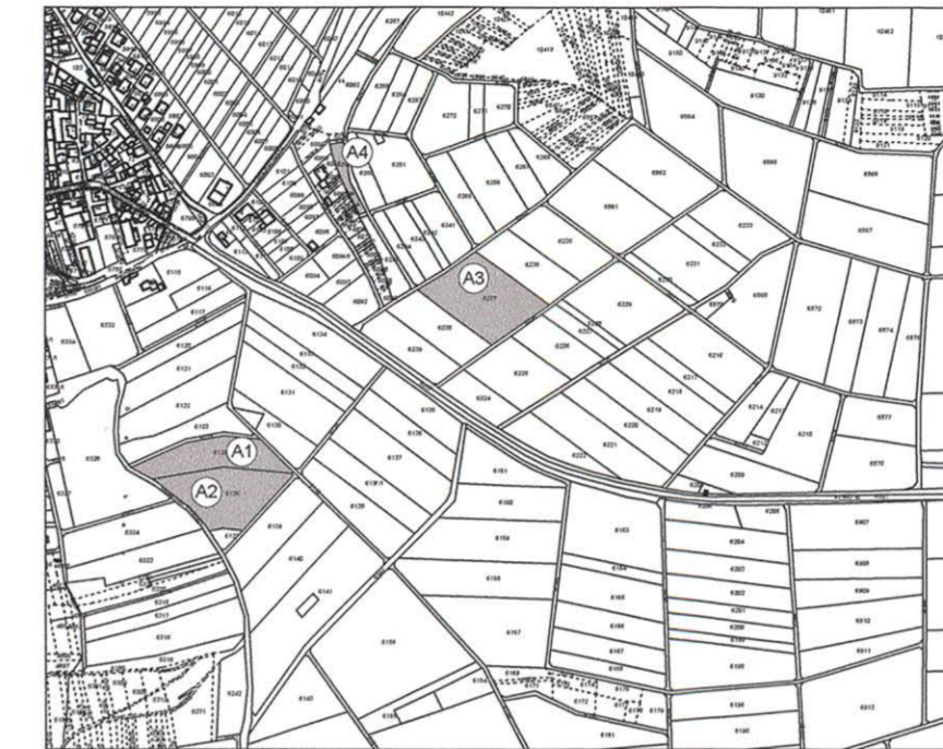
Lage der Ausgleichsflächen M 1 : 10.000

Als Flächen zum Ausgleich der Eingriffe in Natur und Landschaft im Sinne des § 1a (3) BauGB werden außerhalb des Geltungsbereichs als Flächen für Maßnahmen zum Schutz, zur Pflege und zur Entwicklung von Boden, Natur und Landschaft die Maßnahmenflächen A1 bis A4 mit einem Flächenumfang von 2,34 ha (anrechenbar 2,48 ha) festgesetzt.